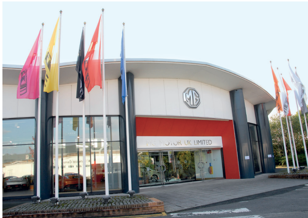
▲ В Бирмингеме находится главный сервисный центр и шоу-рум, представляющий всю линейку MG