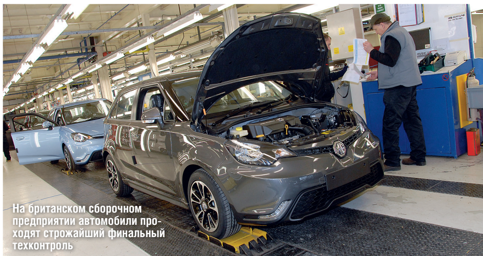
На британском сборочном предприятии автомобили проходят строжайший финальный техконтроль

Лариса МИЦАН-ЧУК получила возможность оценить, какие преимущества приобрела британская марка MG после того, как в нее были влиты миллионы инвестиционных евро