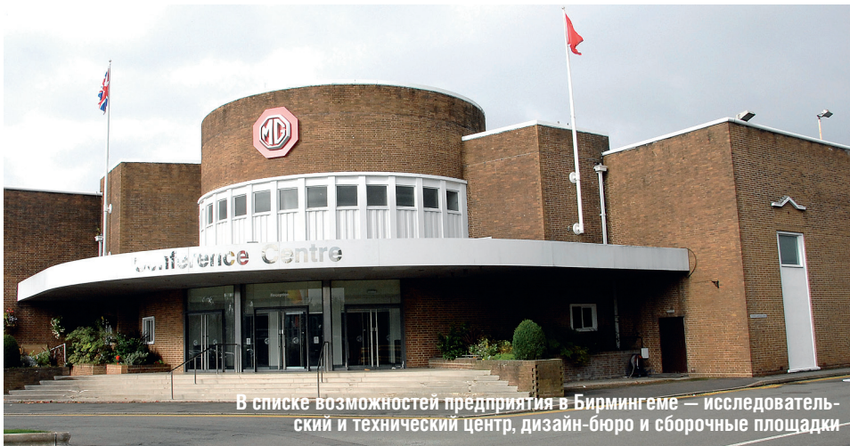
В списке возможностей предприятия в Бирмингеме — исследовательский и технический центр, дизайн-бюро и сборочные площадки

тательные площадки и дизайнерское бюро. Практически все это засекречено, как МИ-6: взглянуть нам разрешили буквально одним глазком. Ну что ж — спасибо и на том, впечатляет сам факт, что нам удалось хоть что-то увидеть.